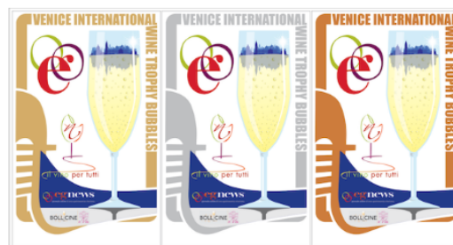
Premi Venice International Wine Trophy Bubbles

La manifestazione “Bollicine in Villa” sarà caratterizzata da un’impronta didattica, con gli espositori distribuiti in base al metodo di lavorazione, per offrire un’esperienza sensoriale coinvolgente e un supporto culturale di altissimo livello. Il tutto sarà accompagnato da cibi e prodotti gastronomici tra i più interessanti del nostro territorio.